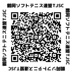
T J S Cクラブ